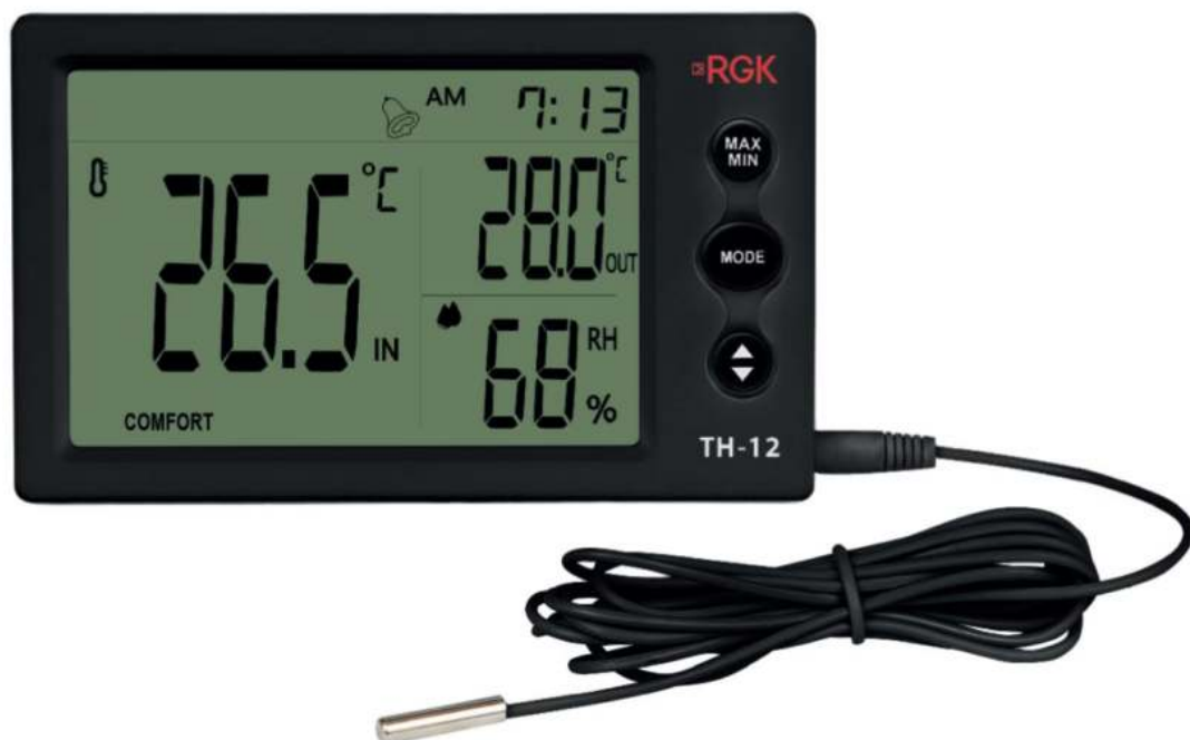
Рисунок 2 – Общий вид термогигрометров RGK модели TH-12 (с внешним датчиком)